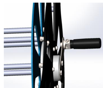
Рисунок 3 Ручка