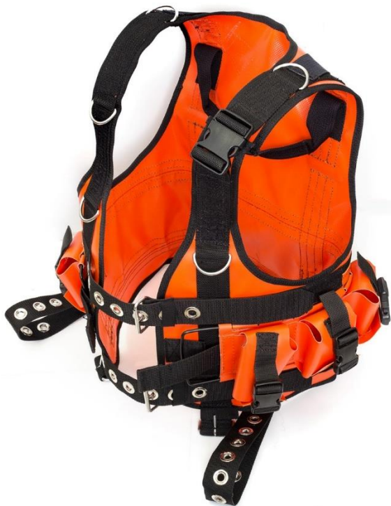
Рисунок 1 Вид с лева