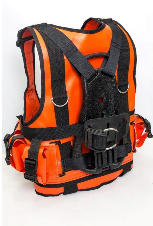
Рисунок 3 Вид сзади