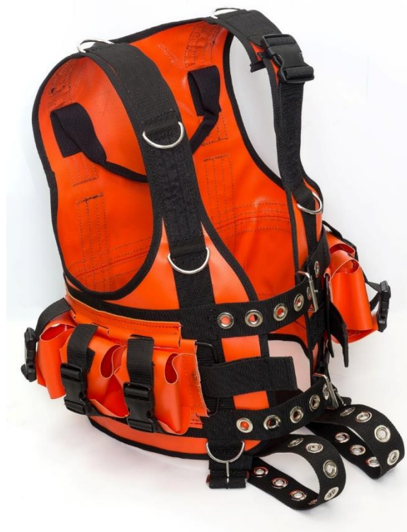
Рисунок 2 Вид с права