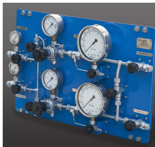
Вид сбоку ППГ 1